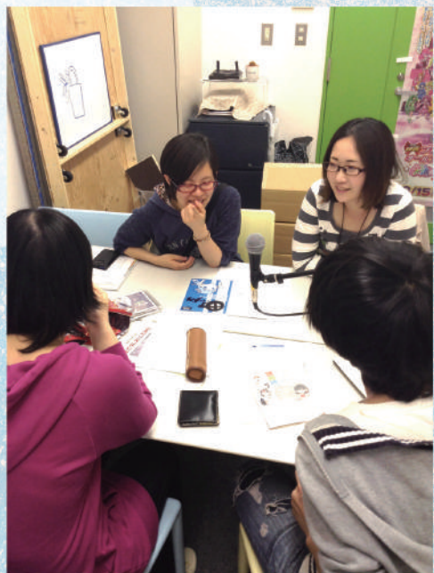
5分間のトーク音声を録音・編集してアップ。木曜日更新。