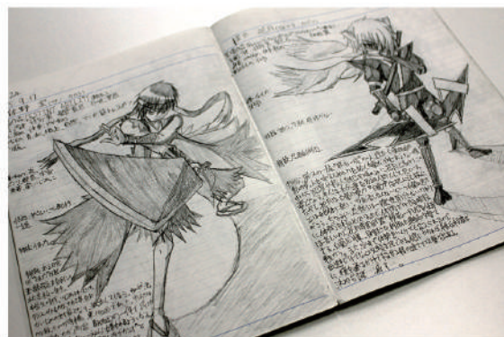
高校時代から温め続けているキャラクター。キャラノートには、たくさんのオリジナルキャラのイラストと性格がびっしりと書き込まれている。

一方で僕は小学1年生のときから剣道を続けていて、今では小学生を教えたりもしています。高校からは同じ道場で居合道も習い始め、大きな大会で優勝したことも。こうして武道を続けて得たものを、今後、僕の絵やマンガの世界で表現していけたらいいな、と思っています。