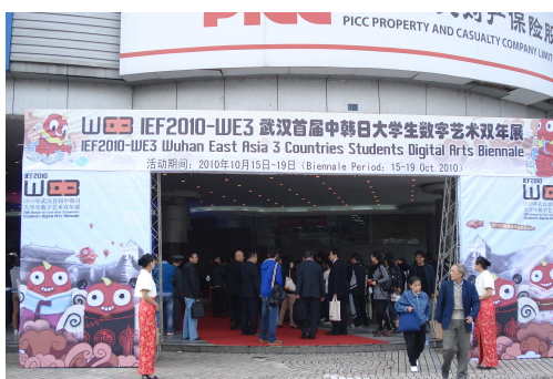
「WE3 ビエンナーレ展」会場外観