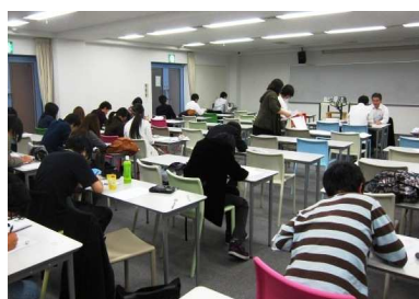
教室内は、黙々とペンを動かす音のみが 響きます