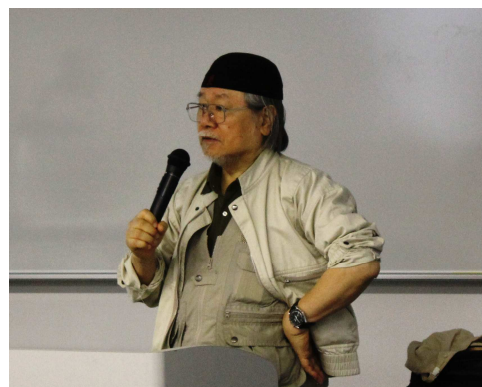
松本 零士 教授

10月23日、宝塚大学 東京新宿キャンパスでミニオープンキャンパスを開催し、松本 零士 教授が特別講義を行いました。冒頭、松本教授は古い一枚の写真を取り出し、その写真の女性と松本教授の先祖の不思議な出会いや、『銀河鉄道999』に登場するメーテルの「顔」、17、18歳のときに松本教授が描いた女性の「顔」との類似性について話を始めました。「絵を描くみなさんの個性は、先祖代々の遺伝子の記憶が作用している」との話に、参加した高校生やその保護者の方は聴き入っていました。