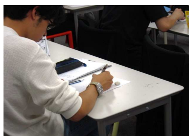
試行錯誤しながらキャラ設定をする学生