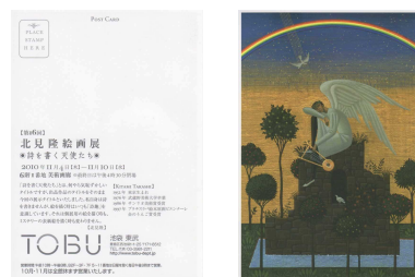
「詩を書く天使たち」POSTカード