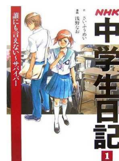
原作『中学生日記 誰にも言えない サバイバー』 (NHK 出版)

2 回目の授業では、同内容のテレビドラマ『中学生日記』を見て、3 回目の授業からキャラクターの設定の授業となります。