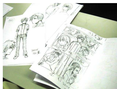
参考として、過去に同じ授業を受けた 学生の作品を見ることができます