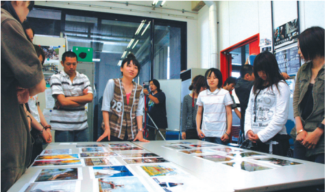
学生の作品をめくって教員も学生も活発に意見をのべあう合評会