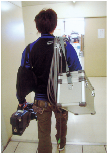
放送の仕事はまず体力！仕事を終えて、事務所へ帰るアシスタントの学生。

(注 これらの仕事は、無償ではなくアルバイトです。春休み、夏休みを中心に休日を利用するようにしています。)(望月 正憲)