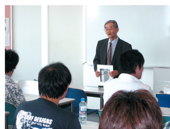
心理アセスメントの授業風景：心理テストは人の心を読み取る手段。投影法、質問紙法、作業法などさまざまな心理テストを学ぶ。

3年生になったら日本芸術療法学会の学生会員になってもらいます。認定資格を得るためには高いハードルをクリアしなければなりません。