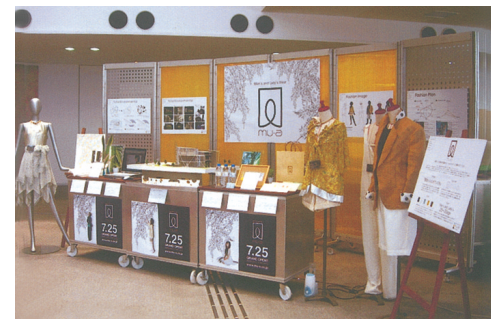
ブランドコミュニケーションの授業を通じて完成した作品

以上の状況を加味してこの授業は構成されています。そして重要な事柄である方針や役割の明確化、コミュニケーションのとり方と調整方法、事柄に存在する問題の解決、リーダーの能力を見極め、そして最も大切なデザインワークとプレゼンテーション等を模擬体験し、実社会につなげて行くことを目的としています。