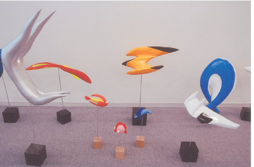
「スピード」又は「浮遊」というテーマで制作したフィギュアデザインの作品（発泡ウレタンに色ラッカー塗装仕上げ）