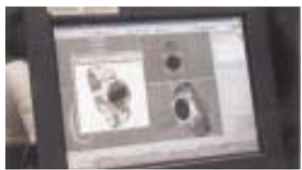
ウェブコンテンツデザインコース授業風景