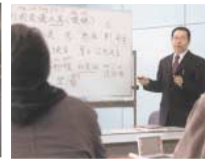
中国語会話を学ぶ授業風景