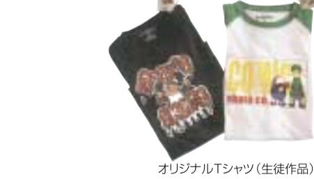
オリジナルTシャツ(生徒作品)

イラストレーター・イラスト制作会社・絵本作家・アーティスト・デザイン会社・デザインプロダクション・広告制作会社・印刷会社・ゲーム制作会社・アニメ制作会社・Web制作会社・イベント企画会社・報道関係・教員(中学校・高等学校)に進むことが出来ます。