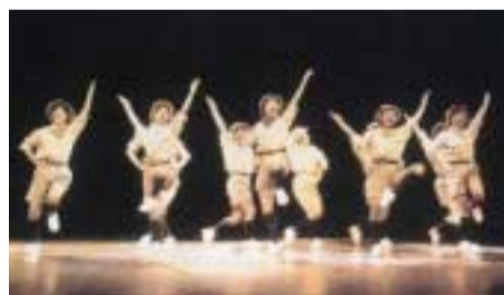
舞台表現演習風景