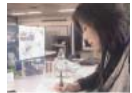
飛行機や宇宙船のデザインも手がけるプロダクトデザイン