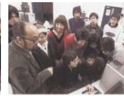
映画の制作プロセスを学習、映画コンテンツ授業風景