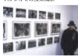
写真コースの授業風景