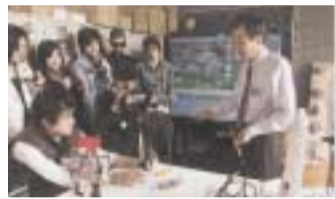
コンピュータメディアアートコース授業風景