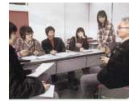
さまざまな分野の作品と関わっていくコンテンツプロデューサーになるための第一歩として複式簿記システムの仕組みを学ぶ、コンテンツ簿記総論授業風景