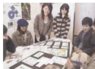
在学中にインテリアコーディネーター資格の取得を指導する