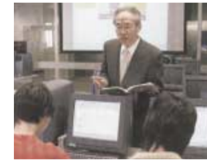
優秀なプロデューサーになるための第一歩として複式簿記システムの仕組みを学ぶ、コンテンツ簿記総論授業風景