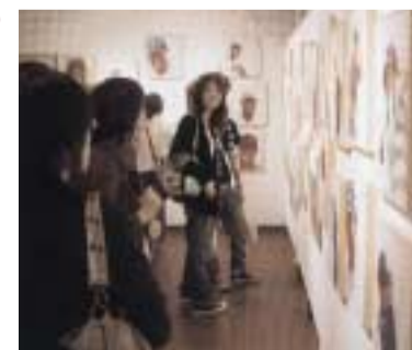
大きな美術館から小さなギャラリーまで、学外授業風景