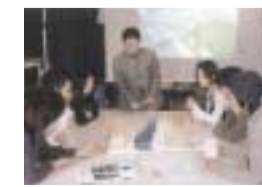
学生が自由に発想する自発的な学びを重視した授業風景