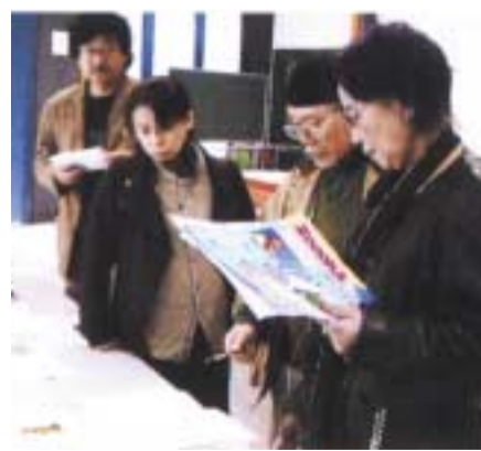
2006年度「ZOOKAマンガ大賞」の選考風景