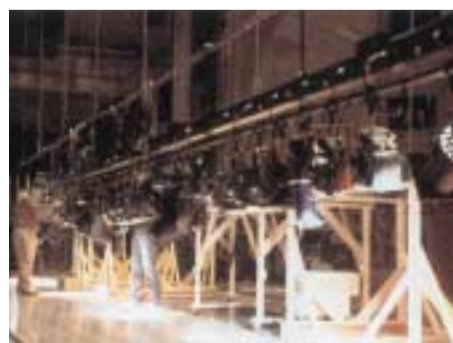
舞台照明デザイン演習風景