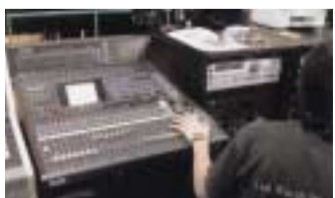
サウンドデザインコース授業風景