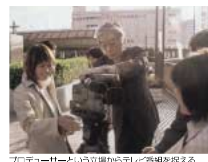
プロデューサーという立場からテレビ番組を捉えるテレビ番組コンテンツ授業風景