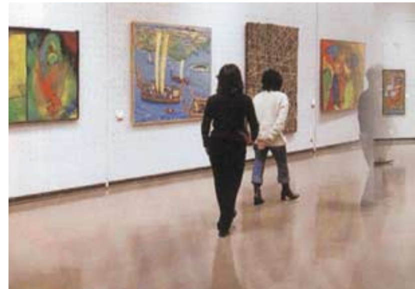
大阪市立美術館で行われた卒業制作

アートは、アーティストとして発信したり、センスを生かして社会の現場で活躍したり、歩み出したら、一生継続、マラソンのようなものです。私達はアートを生涯教育として捉えようとしています。現在、本学の大学院（洋画）に学生と社会人の両方から、18名の在籍者があるのは、世の中の大きな流れ、社会的要請の一つと受け止めています。