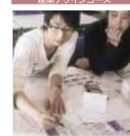
建築デザインコース

コンピュータは建築関係の就職には外せない必須の道具である。1年から基礎を学びながら2年には図面や3D（立体）パースを描けるようになり、3年にはプロ的なスキルを身につけます。