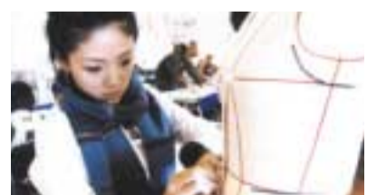
布目や布の流れ、動きを知り、思い通りに表現する力を身につける立体裁断

第3は「ファッション マーケティング」などの企画、MD（マーチャンダイジング）といったビジネススキルの教育です。ファッション産業についてのマネジメントをはじめ、ビジネスの能力を開発するための授業をファッション アートとアパレル制作技術のカリキュラムと並行して、4年間1貫のカリキュラムを組んでいます。1年次より、ファッション アイテムや雑貨の企画、販売のための理論的な知識や技術を「ファッション マーケティング」の授業で習得します。3年次では、産業デザイン学科のビジュアルデザイン&アドバタイジングコース、建築デザインコース、イラストレーションコース、写真コースの学生とコラボレーションしてプロジェクトに取り組む「ブランドコミュニケーションデザイン」をカリキュラムに取り入れています。この授業では、他のデザイン領域とチームを組み、新規のブランド設立のための企画、デザインを実践的に行います。単なるデザイナーとしてではなく、ブランドのプロデューサーとしてのノウハウを習得することができます。さらに、3年次・4年次では、ファッション産業の企業との協力によりインターンシップを行い、実社会を体験します。