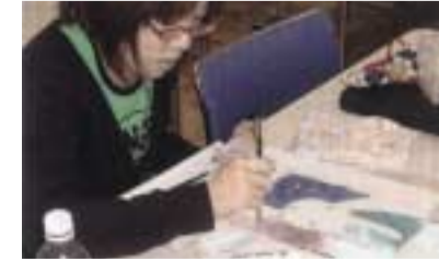
画材の研究や表現の基礎を習得する授業風景