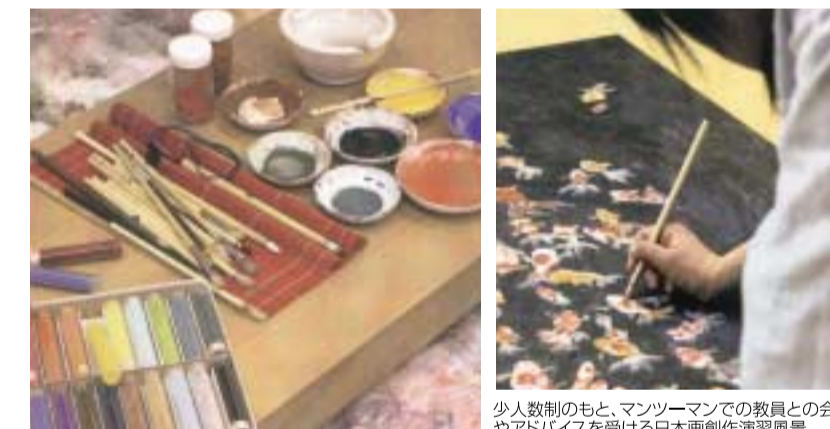
少人数制のもと、マンツーマンでの教員との会話やアドバイスを受ける日本画創作演習風景

才能と意欲のある学生には日展等の公募展やコンクール展に積極的に出品してもらい、毎年のように入選者を出しています。プロの画家や指導者を育てる事を第一義に考えていますが、取得できる資格として中学校・高等学校教諭一種（美術）、美術館・博物館学芸員、各団体展の会員・準会員、その他各種検定士などがあります。