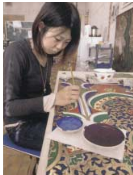
卒業と同時に修復現場での活躍を期待される学生