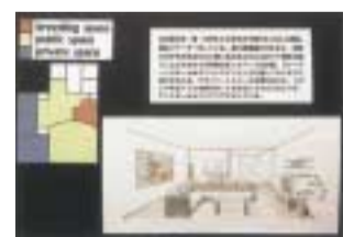
分析力、発想力に加えて、提案力を求められるインテリアデザイン