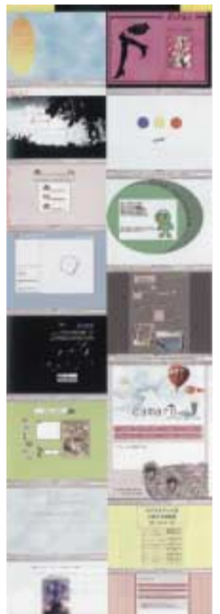
ウェブ・ホームページデザイン(生徒作品)