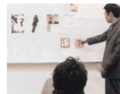
プロデューサーとしてファッションの基礎知識を習得する、ファッションコンテンツの授業風景

※チューリップ商品というのとはもともと「限定商品」の意味だったが、電気用品店などでは「古くなったので生産を中止した、在庫品として限定された商品」というように使われているようです。