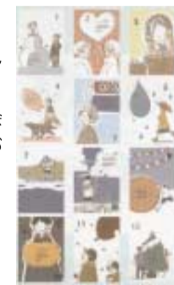
カレンダー(生徒作品)