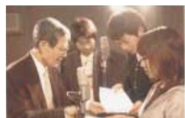
ラジオドラマ制作の実習風景