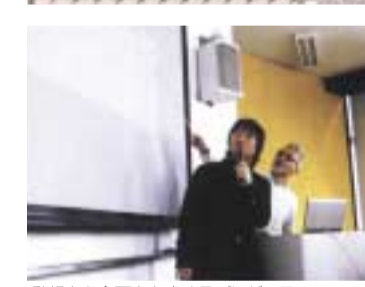
発想力と企画力を高めるプレゼンテーション授業風景