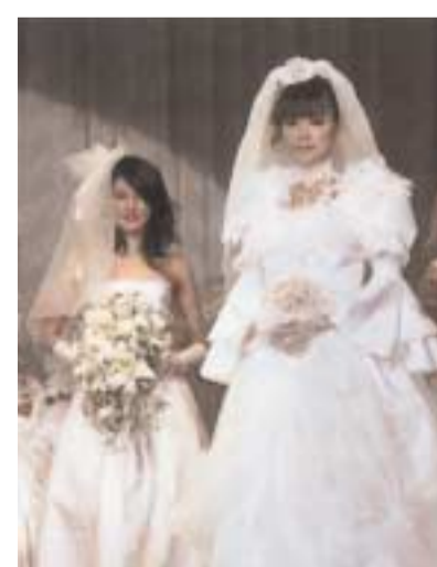
2007年2月16日、ホテル阪急インターナショナルで開催されたファッション ショー