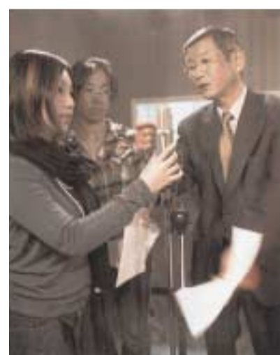
アナウンス・ディスクジョッキーの実習風景