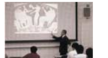
西洋美術の基本知識としてギリシア神話を学ぶ、「西洋美術の源流」授業風景