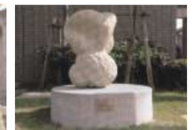
一般企業からの依頼で、彫刻作品を制作（生徒作品）