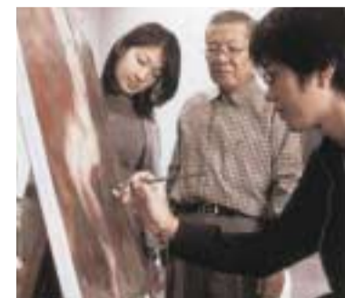
修復作業の授業風景