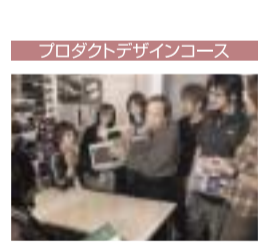
プロダクトコースの授業風景