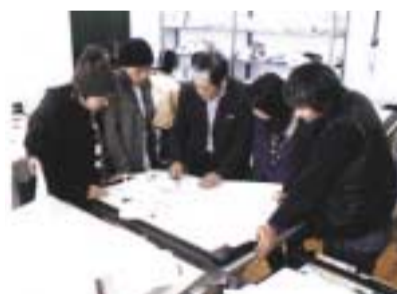
インテリアを構成する製品全般をデザインする授業風景