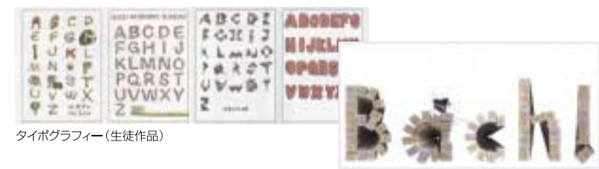
タイポグラフィ(生徒作品)

不定期ではあるが宝塚市、川西市、大阪市、神戸市など近隣の自治体の行政や商工活動の一貫として行なわれるイベントに関するロゴやシンボルマーク、キャラクターの制作といったデザインに関する協力、あるいはコンペ参加を自治体と連携して積極的に対応する様になっている。