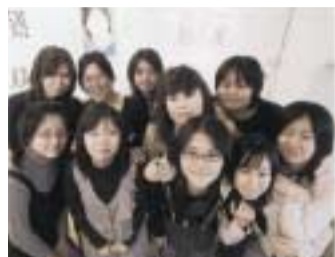
コンピュータメディアアートコースの生徒たち