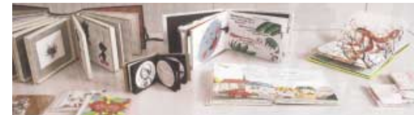
絵本&CDジャケット(生徒作品)