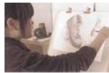
ドローイング授業風景