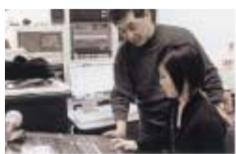
サウンドデザインコース授業風景