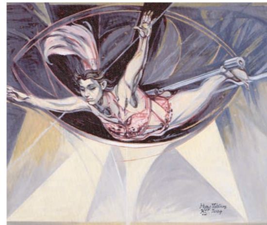
「飛翔人(ホモ・ボラティクス)」 竹村和夫 美術学科教授