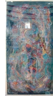
「血管腫」 八木智弘 (洋画2年)