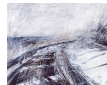
「ドライブ」 今崎順生 (00年卒)