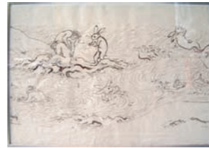
「模写(鳥獣人物戯画)」 北村 藍 (美術史・美術理論1年)