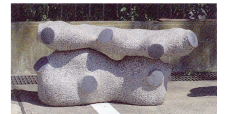
「積雲」 田中和之 (04年大学院修士過程修了)