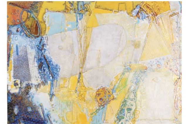
「Dub World-04」 西田周司 美術学科講師