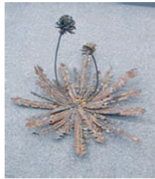
「揺れていたたいよ」 中川つむぎ (彫刻3年)