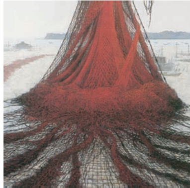
山田 毅 「緋い網」

青垣展 青垣町民センター別館大ホール 2004.10.24(日)～11.14(日) 京都展 京都市立美術館別館 2004.12.8(水)～12.12(日) 東京展 上野の森美術館 2005.2.1(火)～2.6(日)