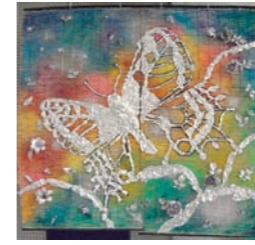
「sunny day」 古川佳奈 (絵画4年)