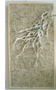
「上へ」 高田雄平 (絵画4年)