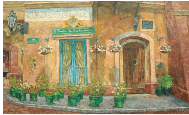
「ポルトヨーロッパ」 荒駒るみ (絵画3年)