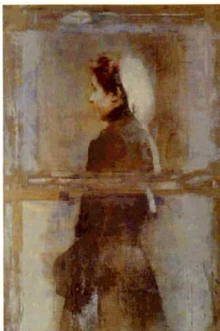
「ブルーニューの女」 ゴム印画法 125×81cm パネル、紙 村田大輔