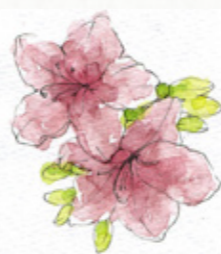
新宿区の花として指定されているつつじ。

商業地と住宅地、歴史ある地名と再開発地域、多国籍といつた、まさに大都市の光景を縮図