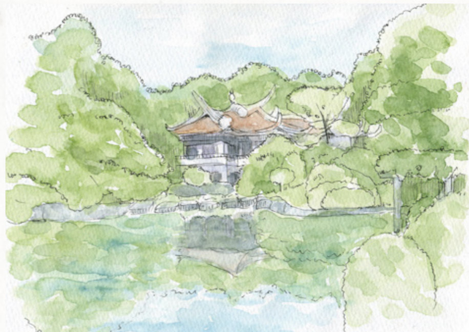
東京都新宿区と渋谷区に跨る環境省所管の庭園、新宿御苑の旧御涼亭前。都会のオアシスであるこの庭園では、季節によって様々な表情を見ることができる魅力がある。

大学とも縁のあるイベントです。アートを通して新宿の魅力づくりやイメージアップを図り、新たな賑わいと活力づくりに取り組むだけでなく、イベントを通して、多くのアーティストに発表・発信の場を提供するという名目もあります。