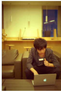
→校舎内のラウンジで作業中。