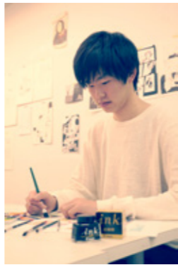
→授業での一コマ。マンガを描くときは真剣です。

マンガを描いていた中学時代の親友と一緒に、同じ高校に行こうと話していました。でも、親がどうしても商業高校に行って欲しいという思いがあって、自分は商業高校に進み、彼は別の高校に入学しました。 中学時代にけっこう本気でバスケットをしていたので、高校でも続けようと思ったんですが、ぼくが入学した高校は女子9割の学校だったんです。もちろん男子バスケットがない。当時、『黒子のバスケ』が流行っていて、バスケットもあったのに、活動する環境がなかったんです。しかも、少ない男子の中でバスケット経験があるのは自分ひとりだけ。それでも『バスケットがしたい』と思って、未経験者を募って、自分が部長になって5人で男子バスケット部を発足させました。平日以外に、土日も練習をすると決めていたんですけど、誰も来なかったんですよね笑。発足して初めての公式戦の前に、メンバーから『バスケ