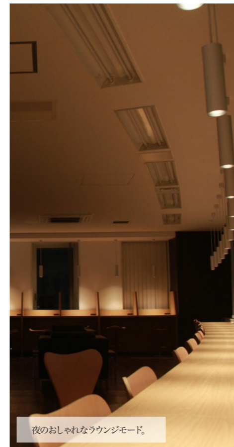
夜のおしゃれなラウンジモード。