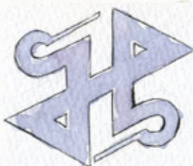
新宿区の紋章(区章) 「新」を菱形にして図案化したもの。

新宿では新宿駅周辺の公共の空間、民間施設等が活用され、様々なアートイベントが開催されており、区民や来街者が文化