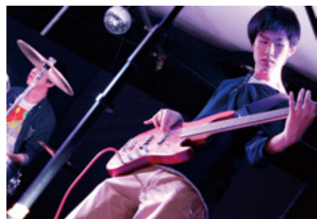
←目立ちたい!という思いから始めたバンド活動。ベースがないからという理由で、ベース担当に。興味のあることには貪欲な性格。現在動画を見ながら、ベースの練習中。

実際、入学して感じたのは自分の実力が周りの人に比べて低いということ。落書き程度で描いていた自分にとって、周りの友達との差をすごく感じてしまいました。でも、1から先生に教えてもらうことができましたし、安心して授業に出ていましたね。人物デザインの授業はとて勉強になって、目の前のモデルを見ながら、クロッキーにひたすら描く練習は自分が成長していることを実感できます。入学したときの自分と比べると、うまくなったな、と思います笑。入学当初は他人と比べて自分がどうか思っていました。他人の意見を素直に受け入れて、自分の意見もしっかり持つことができれば、自分の引き出しも増えますし、マンガを描くときももちろんいいものが描けると思っています。