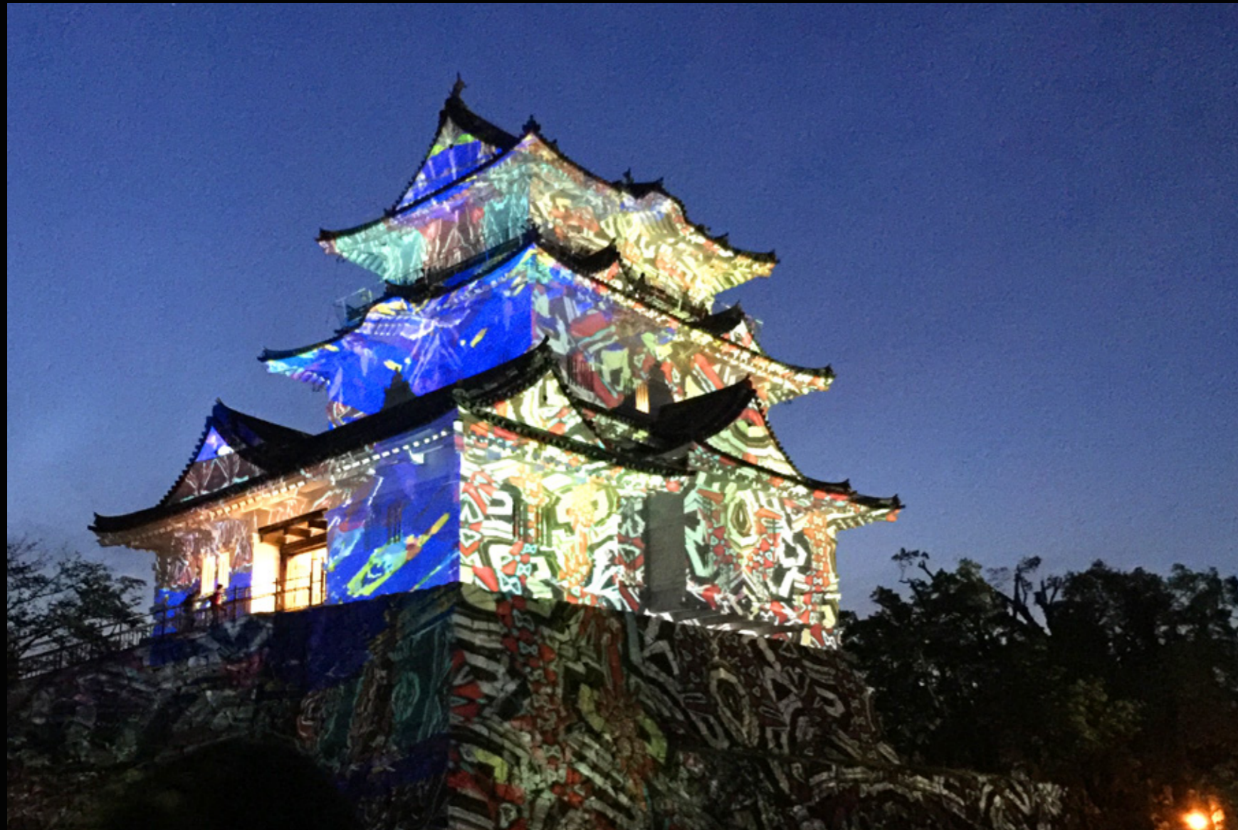
映像が投影された小田原城の様子。