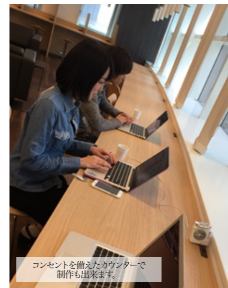
コンセントを備えたカウンターで制作も出来ます。