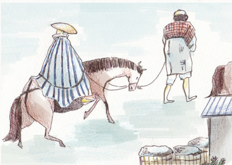
四谷内藤新駅。 馬に乗って三度笠に合羽を着た旅人が江戸の方に進んでいく様子。