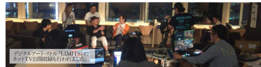
デジタルアートバトル「LIMITS」のネットTV公開収録も行われました。