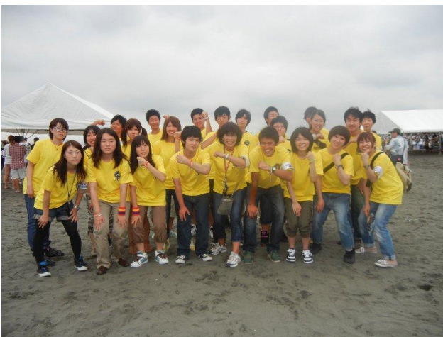
当日の参加スタッフでの記念写真

当日は入場者の受付対応、観光 PR ブースでの補助業務などを行ったほか、ライブの最後には、参加した高校生スタッフと共にステージに上がり、東北にエールを送りました。