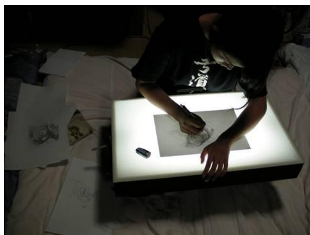
一心不乱に作画に取り組む学生