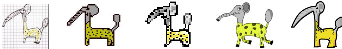
例) 南相馬市会場で子どもたちが描いてくれた絵 (一番左) を、画像として扱いやすいようにアップデートしたビットマップ、イラスト

各チームが制作したゲームなど、詳細につきましては IGDA 日本のホームページをご参照下さい。 IGDA 日本 (WEB サイト) http://www.igda.jp/modules/bulletin/