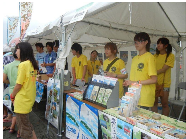
観光 PR ブースでの活動の様子