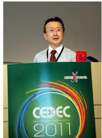
桜木 晃彦 教授

CEDEC は、ゲームクリエイターやコンテンツ制作関連スタッフたちが人材交流と技術面での情報交換を目的とした、日本最大のコンピュータエンターテインメント開発者向けカンファレンスです。今年の CEDEC2011 は 9 月 6 日 (火) から 8 日 (木) まで、横浜市のみなと未来の催事施設、パシフィコ横浜で行われました。