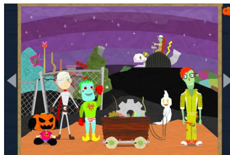
『Halloween Kids Picture Book』 のワンシーン