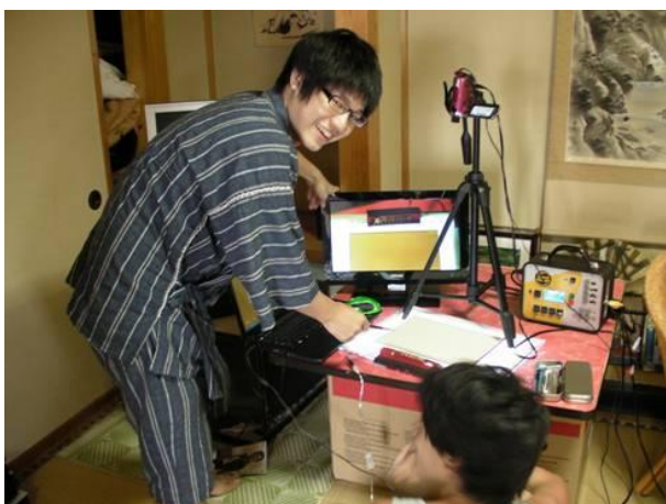
大学から持ち込んだ機材も使用