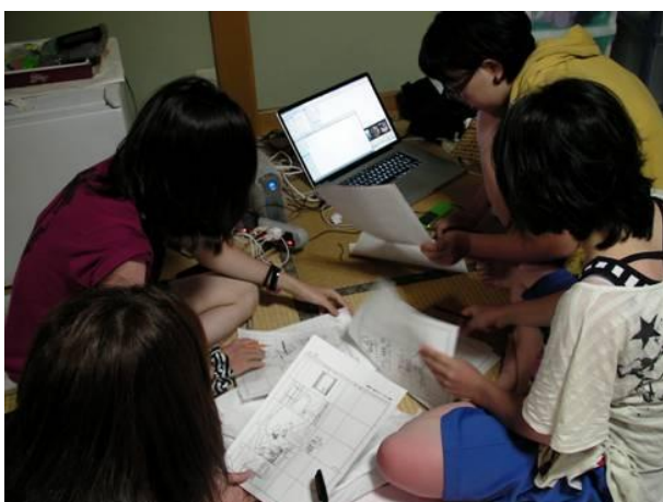
絵コンテについて意見を交わす学生たち

今回の合宿に参加した学生8名は、絵コンテの作成や作画に夜遅くまで取り組むなど、大学から400km以上離れた静かな環境で、創作活動に集中できました。また、集団活動を行うことで、作品制作に欠かせない団結力をより強固なものにしました。