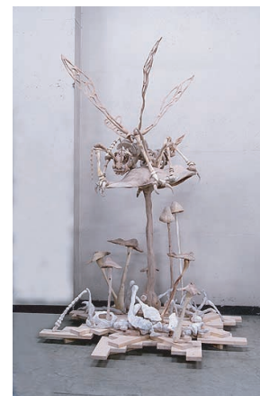
「幻のキノコ狩ツアー!!!」 彫刻部奨励賞 難波爆 (03年卒)