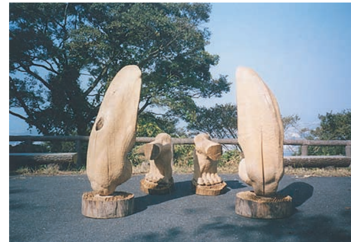
「沈黙と静寂」彫刻部奨励賞 会友出品 準会員推挙 安川弘造 (01年大学院修士課程修了)