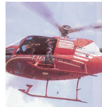
ヘリコプターの下部にそなえつけられたソリの上 に立ってLOCO CUPを投下する嶋本昭三教授

2005ベネチアビエンナーレのパフォーマンス部が確立されるためのプレイベントとして、嶋本昭三グループとイタリアのPROXIMAの両方がベネチアビエンナーレの秀作が展示されているイタリア・ベニスのカ・ペーザロを舞台として様々なパフォーマンスを試みた。