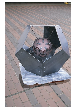
「自身のジレンマ」 社奨励賞 丸山智史 (修士課程2年)