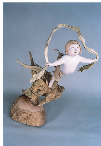
「山の雲の上の風の神の女の子」会員出品 西村公泉 彫刻コース教授