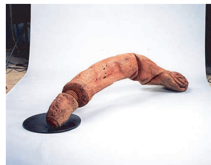
「ん」準会員出品 合田望 (02年大学院修士課程修了)